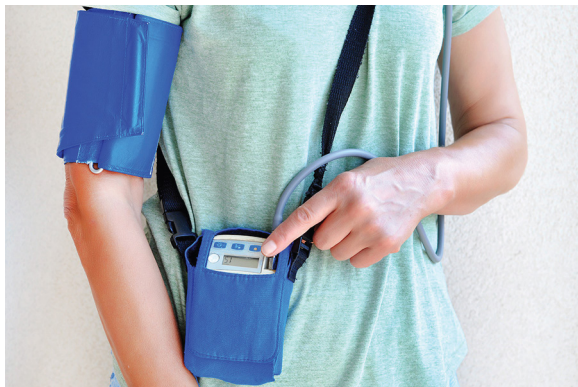
图1. 患者居家治疗监测示例。

随着医疗健康信息技术系统的不断发展，现在医生能够在患者同意的情况下访问获取患者的数据。用户可以使用手机获取常规检查报告，也可以轻松查看放射学和病理学报告，毫无疑问，这会大大促进以患者为中心的医疗健康应用的普及。图1所示为一个监测系统示例。